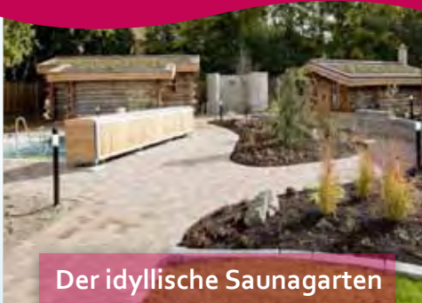
Der idyllische Saunagarten

Evi Rossa gönnt sich eine Massage in der Damensauna