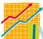
Wirtschaft und Verwaltung