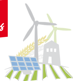
Agrarwirtschaft, Bio- und Umweltechnologie

E-Mail: schulen@senivita.de ; www.senivita-schulen.de