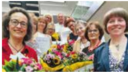
Das Zeitschenker-Team

Im Zeichen der Nächstenliebe und der Mitmenschlichkeit wollen die neuen Zeitschenker am Klinikum den Patienten